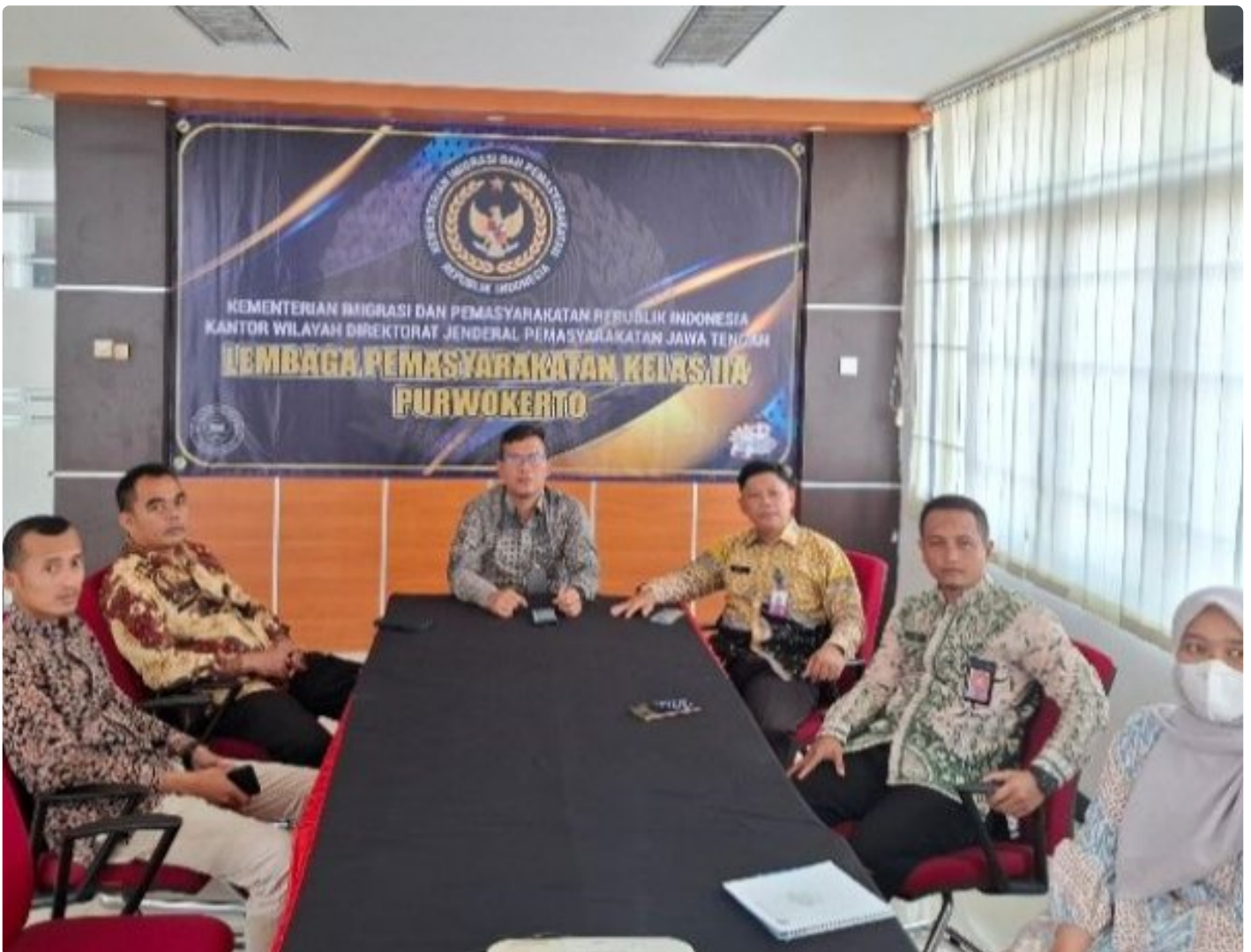
Lapas Kelas IIA Purwokerto Ikuti Entry Meeting Pemeriksaan BPK RI Atas Laporan Keuangan Kementerian Hukum dan HAM Tahun 2024 secara Virtual

PURWOKERTO - Lembaga Pemasyarakatan (Lapas) Kelas IIA Purwokerto mengikuti Entry Meeting Pemeriksaan atas Laporan Keuangan Kementerian